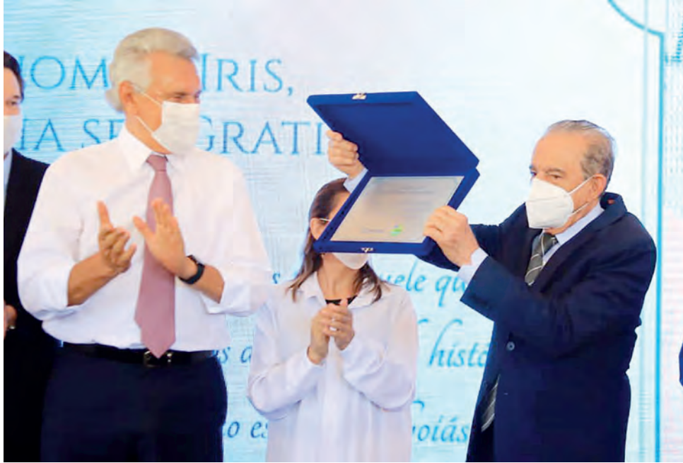
Governador Ronaldo Caiado convida Iris Rezende para ajudá-lo a “finalizar” os próximos dois anos de mandato durante ato em que recebeu homenagem especial da Saneago: “Vossa excelência terá função e carga horária com compromisso ao meu lado para podermos construir esse marco na nossa história política”

medo de errar, que Goiás está orgulhoso de vossa excelência. Tem confiança absoluta nos seus atos, nas suas ações”.