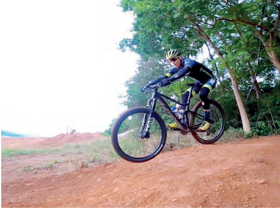
Abraão Azevedo desenvolveu a nova pista de mountain bike