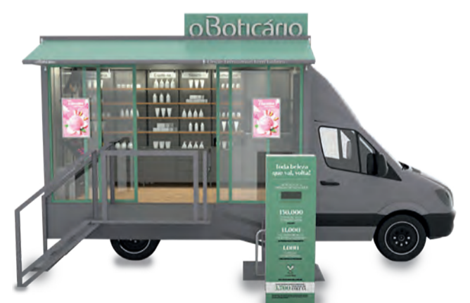
Projeto piloto de loja itinerante funcionará nos dias 21, 23 e 24 de novembro

Além da possibilidade de adquirir seus produtos preferidos, aqueles que tiverem interesse em