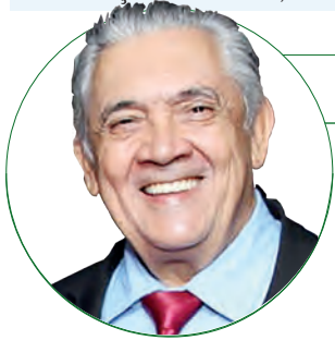
HD Hércules Dias www.herculesdias.com.br