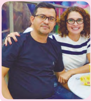
Album de família

Após meses em confinamento, sem poder sair de casa, o povo está ansioso para voltar a viajar e rodar pelos quatro cantos do País. É o que constatou pesquisa Elo / TrVI lab: 83,27% não realizam viagens a lazer desde abril. Em entrevista, 55% querem viajar. O carro é a opção de transporte preferida de 61% dos entrevistados. E os destinos mais procurados são praias e campos, apontado por 74% das pessoas.