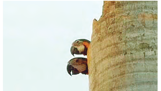
Luis Carlos Chilanti

desses animais silvestres serem tão importantes para a natureza e o motivo deles migrarem para os centros urbanos. "As araras têm papel fundamental para preservação do Cerrado por serem dispersoras de sementes, contribuindo com a repovoação e a manutenção da flora do Cerrado. Com o avanço da tecnologia e o aumento de plantações, pastos e lavouras, essas aves estão se deslocando cada vez mais para as cidades em busca de natureza para se manterem vivas", pontua.