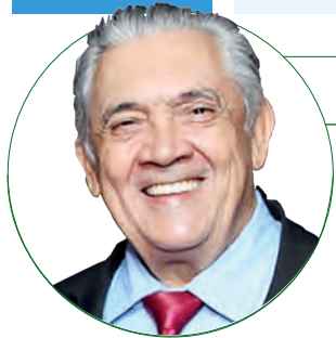
■ HD Hércules Dias www.herculesdias.com.br