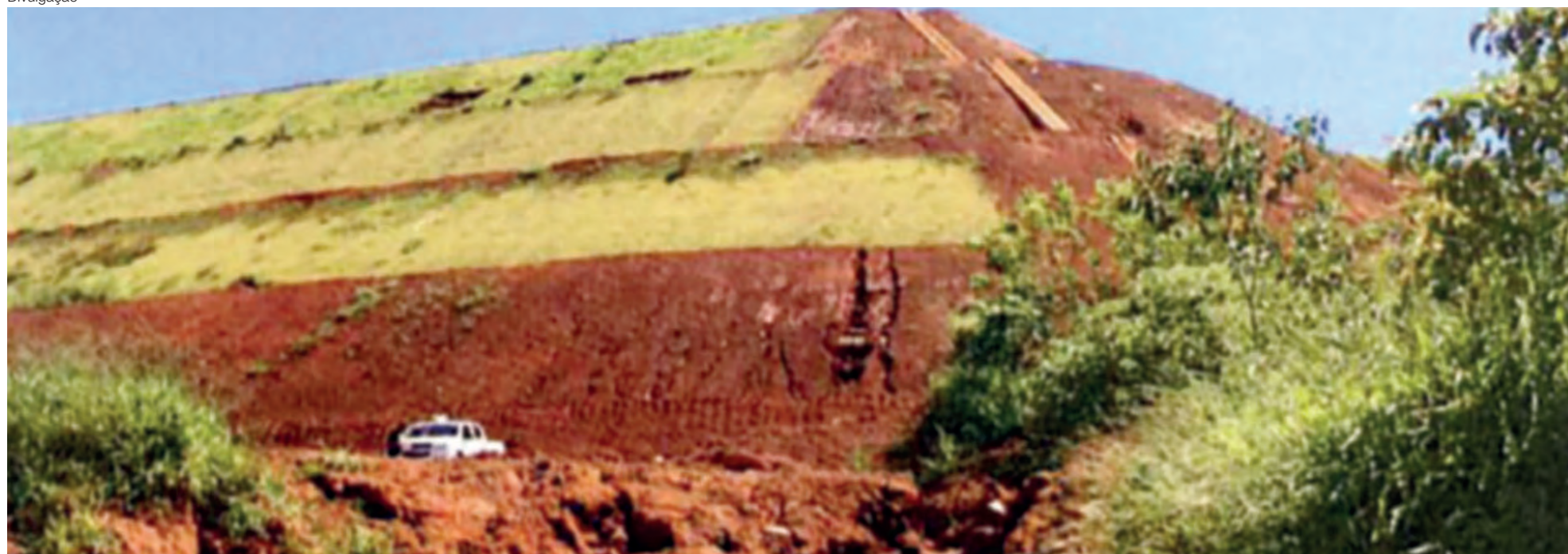
em fiscalização realizada em 2016