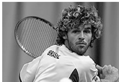
A Luta de Guga