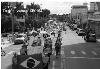
Por um Brasil melhor

A inexistência, até então, de uma Política Setorial no SUS que atendesse a diversidade dos povos indígenas comprometia o acesso adequado às ações de saúde, impossibilitando o exercício da cidadania e a garantia das diretrizes estabelecidas na Constituição, no que diz respeito ao atendimento de saúde diferenciado dos índios. ■