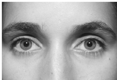
O Cuidado com os olhos