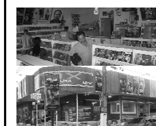
Av. Bento de Godoy 648