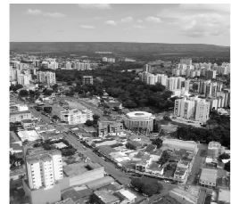
Este espaço pode ser seu!

Anuncie seu produto ou serviço e ganhe um mundo de vantagens