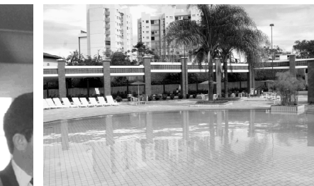
Sesc prepara programação especial em Caldas Novas