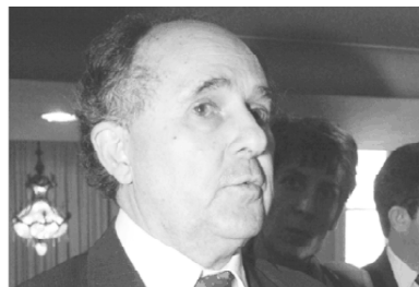
Um desabafo de quem foi traído

No caso de não se tomarem medidas drásticas, de forma a controlar a emissão de gases de Efeito Estufa é quase certo que teremos que enfrentar um aumento da temperatura global que continuará indefinidamente, e cujos efeitos serão piores do que quaisquer feitos provocados por flutuações naturais, o que quer dizer que iremos provavelmente assistir às maiores catástrofes naturais (agora causadas indiretamente pelo Homem) alguma vez registradas no planeta. ■