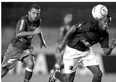
Começa o Campeonato Brasileiro de 2006