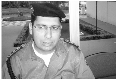
Sangue Novo: Novas Idéias