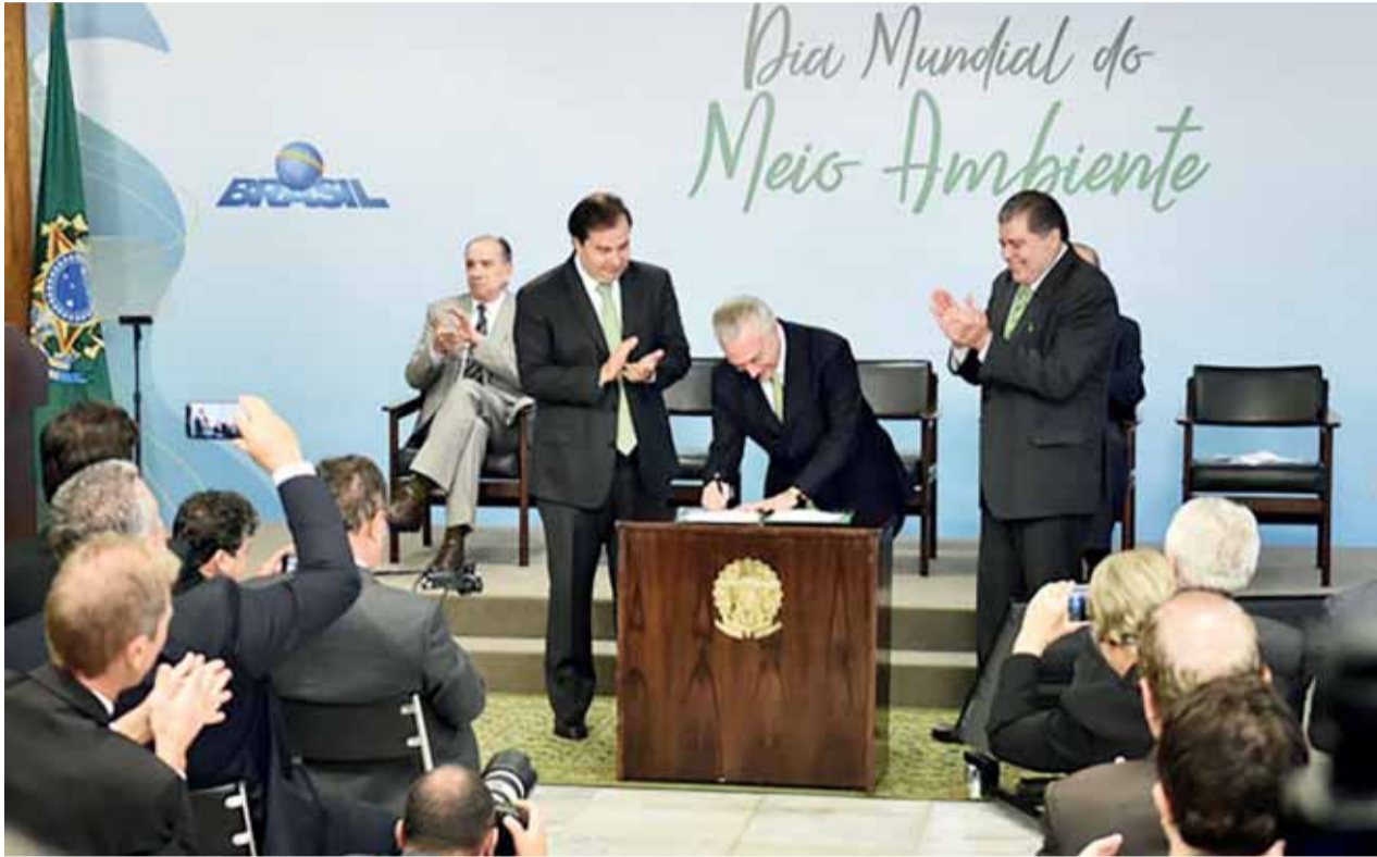
Parque Nacional da Chapada dos Veadeiros, em Goiás, agora será de 240 mil hectares. O decreto foi assinado pelo presidente da República, Michel Temer, na manhã desta segunda-feira (5)

Em solenidade para comemorar o Dia Mundial do Meio Ambiente, outras duas unidades de conservação nacionais estão incluídas