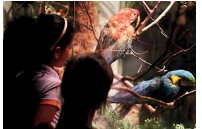
Passar a noite entre animais para observar e aprender sobre o hábito noturno deles é a proposta do projeto Zoo Noturno, da Fundação Jardim Zoológico de Brasília

Passar a noite entre animais para observar e aprender sobre o hábito noturno deles é a proposta do projeto Zoo Noturno, da Fundação Jardim Zoológico de Brasília. A terceira edição da iniciativa ocorrerá em 24 e 25 de junho.