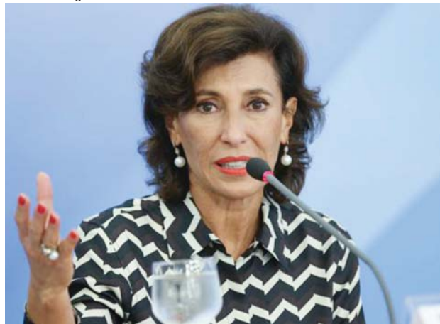
Presidente do BNDES, Maria Sílvia Bastos Marques anunciou novas políticas operacionais e condições de financiamento que entram em vigor esta semana

“Uma busca nossa foi por ter uma atuação horizontal. O banco sempre atuou com setores com percentuais diferentes em TJLP, e sempre há críticas e insatisfações. Nós agora não estamos olhando para os setores, estamos olhando para os tipos de projetos, e vamos priorizar o uso de TJLP em projetos com atributos em saúde, inovação, educação, com impacto ambiental positivo”, afirmou a presidente do BNDES, Maria Sílvia Bastos Marques.