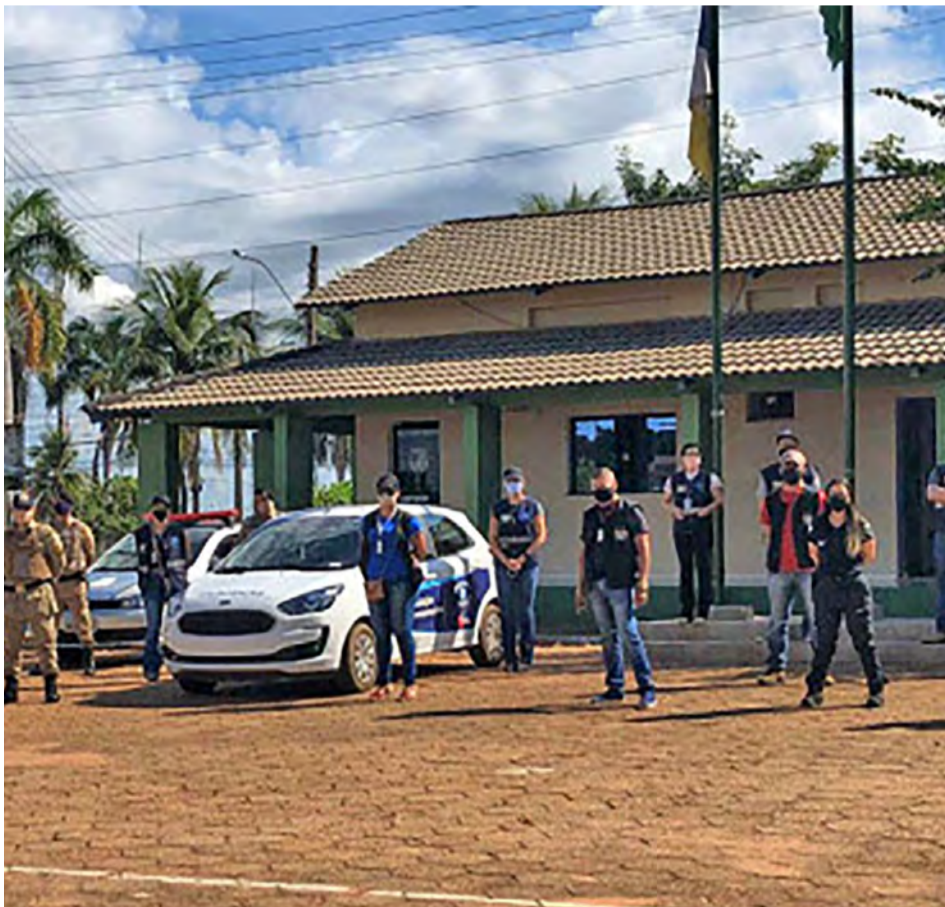
Operação foi desencadeada em Araguaína na sexta-feira passada, 15, e ninguém foi autuado

As Forças de Segurança intensificaram desde a última quinta-feira, 14, a fiscalização nos municípios e vão atuar de forma mais incisiva para assegurar o distanciamento social ampliado. As ações acontecerão em cumprimento a determinação do governador Mauro Carlesse no Combate à Covid-19. Na quinta-feira passada, 14, as forças de segurança atuaram em Paraíso do Tocantins, já na manhã de sexta-feira, 15, uma operação integrada foi deflagrada em Araguaína, na região norte do Estado. A expectativa é de que outras operações como essas aconteçam nas demais cidades nos próximos dias.