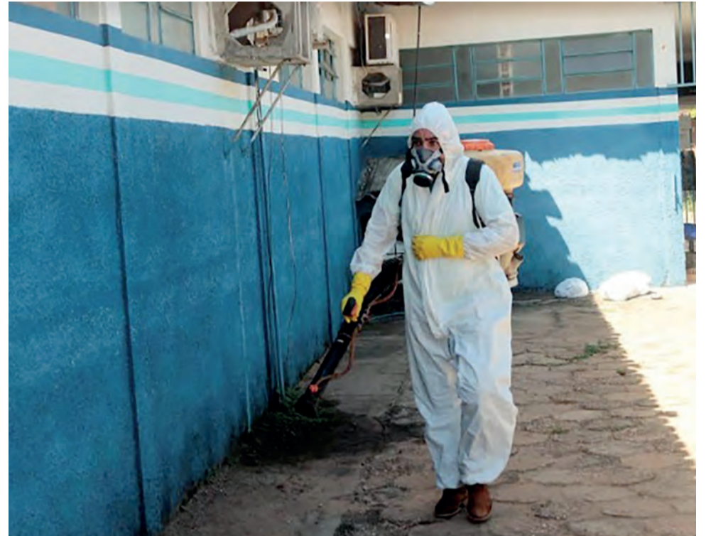
O serviço foi realizado tanto na parte interna quanto na área externa do prédio

ASCOM/TOCANTÍNIA - O procedimento se baseia na limpeza e aplicação de produtos que eliminam os vírus e ajudam a manter o ambiente imunizado. A iniciativa está inserida num plano de ação do poder público municipal visando a prevenção e o combate à proliferação da Covid-19 no município.