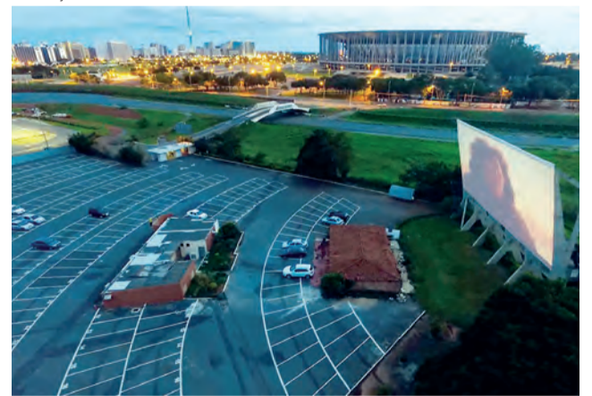
Cine Drive-In é o único do gênero em toda a América Latina