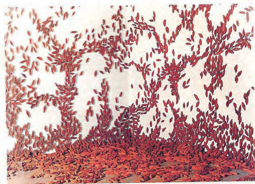
Vagas - cerâmica - 5000 peças dimensão variada - Florianópolis SC - 1998

“Mirante” fica aberta à visitação entre 16 de dezembro de 2017 a 31 de janeiro de 2018 na Vila Cultural Cora Coralina