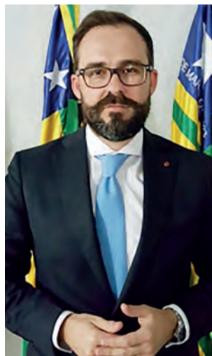
Lúcio Flávio é contra abertura de novo curso

ampliando o leque de disciplinas oferecido pela universidade com a consequente criação de facilidades para o acesso dos alunos, representou, na avaliação do governador, a coroação de um trabalho visionário iniciado em 1999, quando chegou ao governo do Estado pela primeira vez.