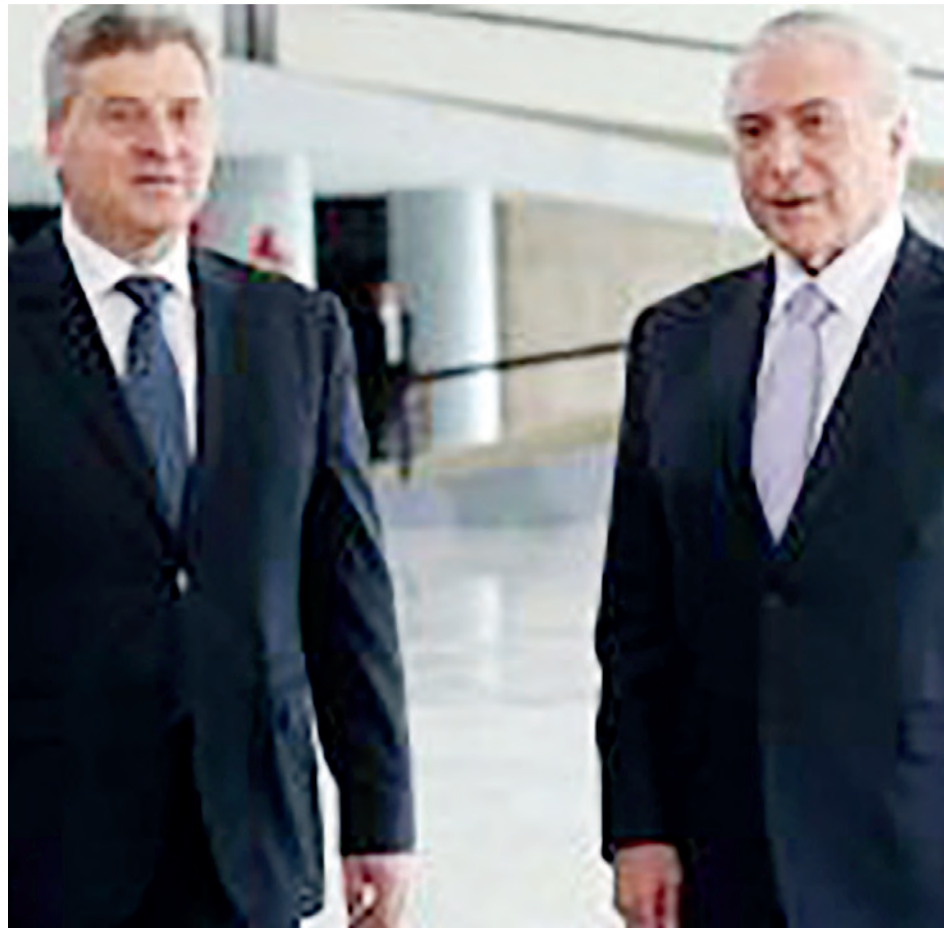
O presidente Michel Temer recebe o presidente da Macedônia, Gorge Ivanov, no Palácio do Planalto

Segundo Temer, o início das discussões sobre a reforma será na quinta-feira (14) e vai ajudar a esclarecer dúvidas que ainda persistem