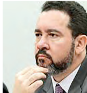
O ministro do Planejamento, Desenvolvimento e Gestão, Dyogo Oliveira, durante audiência pública sobre reforma da Previdência na Comissão Mista de Orçamento

O ministro do Planejamento, Desenvolvimento e Gestão, Dyogo Oliveira, disse hoje (12) a jornalistas que há a possibilidade de a União descontingenciar mais recursos ainda neste ano. “Temos uma sistemática legal prevista de revisões periódicas de receita e despesa. Ainda não iniciamos esse processo. Se ele for feito e se o resultado dele for positivo, é uma obrigação nossa, até porque tivemos um ano muito duro em termos de corte no orçamento”.