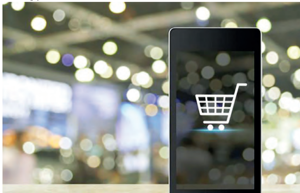
Compras online são uma das principais ameaças à sobrevivência dos centros comerciais