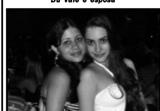
Hanna e amiga