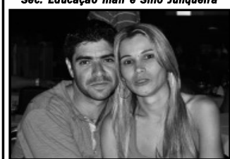
Du Vale e esposa