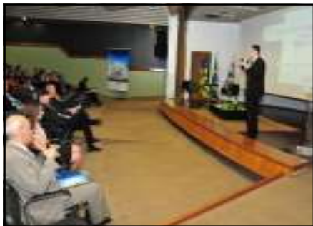
Procurador-geral de Justiça apresenta gestão estratégica para cerca de 200 pessoas

O plano estadual será coordenado pela Secretaria da Fazenda e executado pela Secretaria de Planejamento e Desenvolvimento (Seplan), com o apoio de técnicos de um consórcio liderado pelo Instituto Sagres, de Brasília. Na