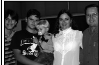
Caixa Econômica Federal