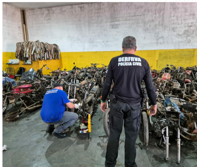
Polícia Civil de Goiás

Na manhã desta quinta-feira (22), a Polícia Civil de Goiás, por meio da Delegacia Estadual de Repressão a Furtos e Roubos de Veículos Automotores (DERFRVA), em conjunto com o Laboratório de Identificação Veicular da Superintendência de Polícia Técnico-Científica, realizou a Operação Circulação Ilegal. A ação ocorreu em Goiânia e Aparecida de Goiânia, com o cumprimento de quatro mandados de