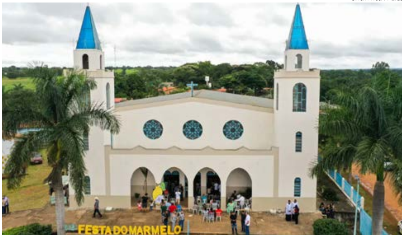
Cidade Ocidental (GO) - Festa do Marmelo, no Quilombo Mesquita

O primeiro registro da terra ocorreu em 1746. O reconhecimento como quilombo, no entanto, chegou apenas em 2006,