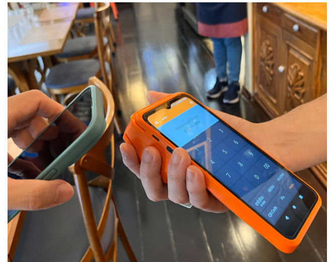
Secretaria da Economia

Segundo a Secretaria da Economia, a medida busca aprimorar o controle das operações comerciais, reduzir riscos de fraudes e preparar os contribuintes para as mudan-