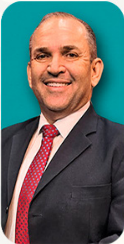
EUBE MESSIAS CIENTISTA POLÍTICO