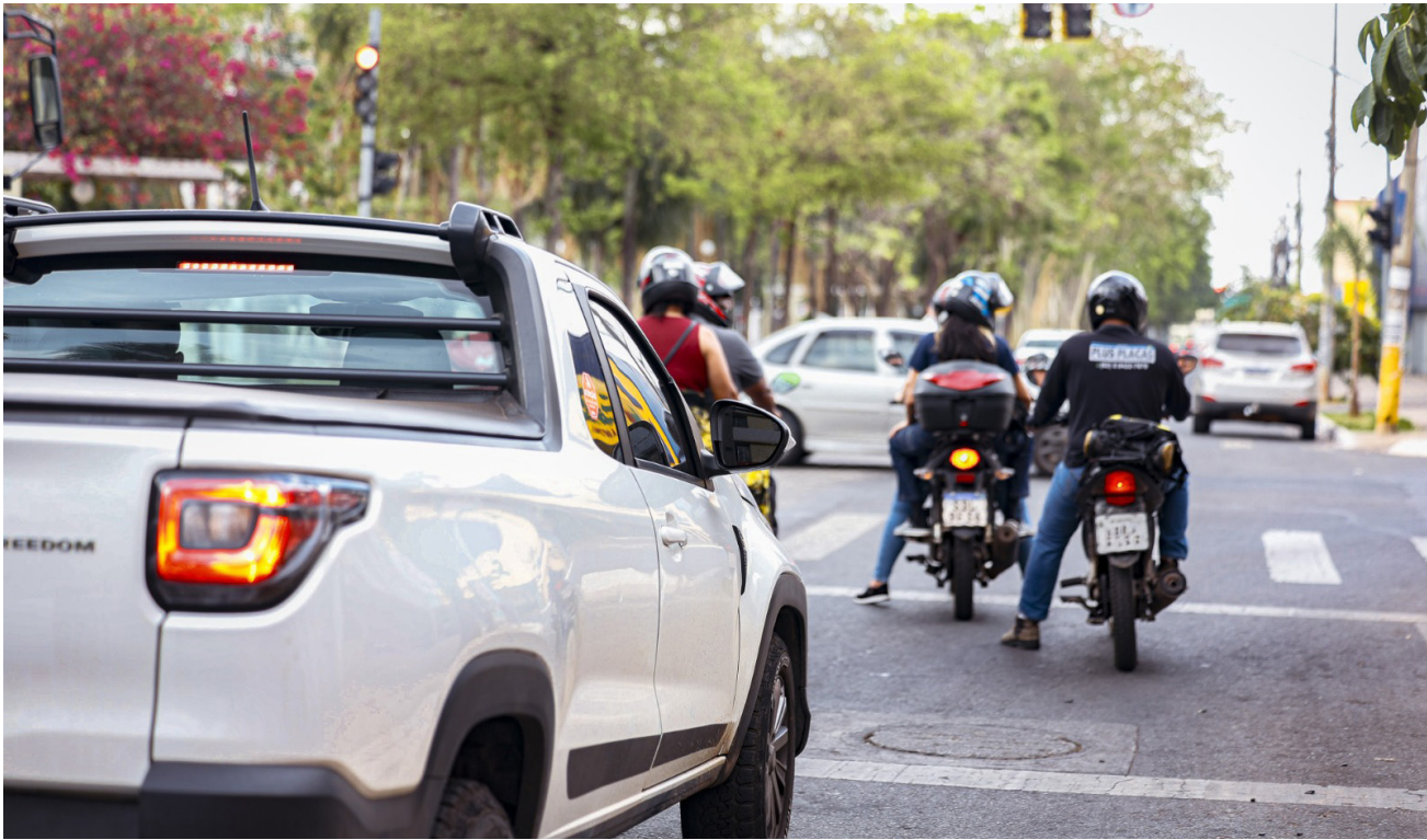
Secretaria de Economia

O Governo de Goiás prorrogou até segunda-feira (20) o prazo para pagamento do valor total do Imposto sobre a Propriedade de Veículos Automotores (IPVA) 2025 e do licenciamento anual de veículos com final de placa 3, 4, 5, 6, 7, 8, 9 ou 0. A Instrução Normativa com a prorrogação será publicada nesta semana. De acordo com a Secretaria da Economia, a decisão foi tomada em razão da alta demanda de acessos, que provocou sobrecarga nos portais de atendimento eletrônico. A medida tem o objetivo de assegurar que todos os contribuintes consigam emitir os boletos e realizar o pagamento sem dificuldades. Até o novo prazo, não haverá cobrança de multas nem de juros. A emissão do Documento Único de Arrecada-