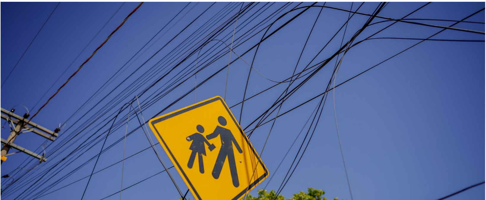
Paulo de Tarso

De acordo com o texto, em caso de constatação de irregularidade, a Administração Pública notificará a